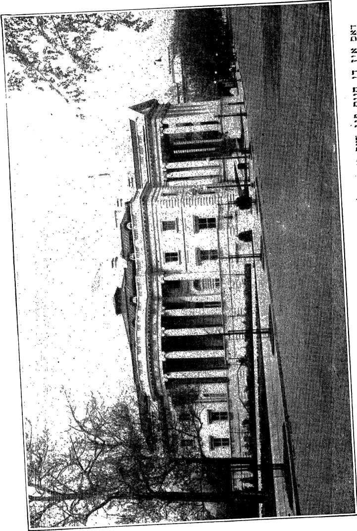
בנין תלמידי חכמים פון דער נאציאנאלער ארגאניזאציע, שטעטל פון דער אמעריקאנער רעוואלוציע (אמסטרם און דרו אמריקא רעוואלוציע), וואשינגטאן, ד. ק.